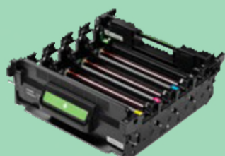
Unité tambour DR625CL