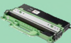
Boîte de récupération de toner usagé WT229CL