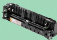
Unité de fusion FD-5000

Kit d'alimentation papier pour bac multifonction PF-M5000