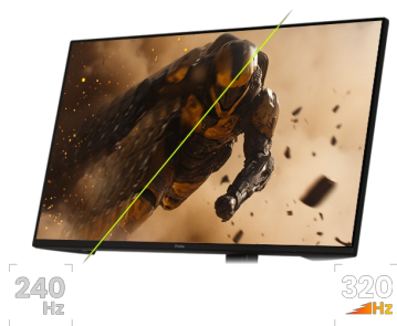
320Hz & 0.6ms MPRT

Pensé pour un confort maximal pendant les longues sessions, ce moniteur est doté d'un pied réglable en hauteur qui vous permet d'ajuster facilement la position de l'écran selon vos préférences.