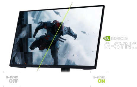
Compatible NVIDIA G-SYNC

Avec un taux de rafraîchissement de 320Hz et un temps de réponse MPRT de 0.6ms, la force est avec vous ! Prenez des décisions en une fraction de seconde et assurez-vous que l'image affiché à l'écran est toujours nette et fluide.