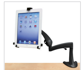
Bras pour tablette sur bureau Neo-Flex